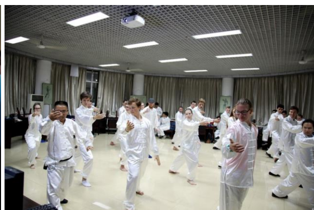
На фото зліва: студенти слухають лекцію, присвячену наноматеріалам та нанокаталізу. Справа: заняття з бойового мистецтва Тай Чі.

В рамках першої частини програми учасникам пропонувалось прослухати курс лекцій, присвячених передовим досягненням хімічної та біологічної наук. Лекторами виступали як професори USTC , так і всесвітньо відомі науковці із інших університетів. Так, одну з лекцій, присвячену передовим технологіям візуалізації біологічних об'єктів на нано рівні, прочитала